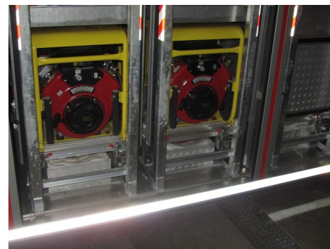
2x Rollcontainer: Stromerzeuger + Licht