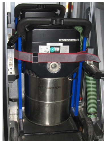
Feuerwehrsauger WAP SQ 650